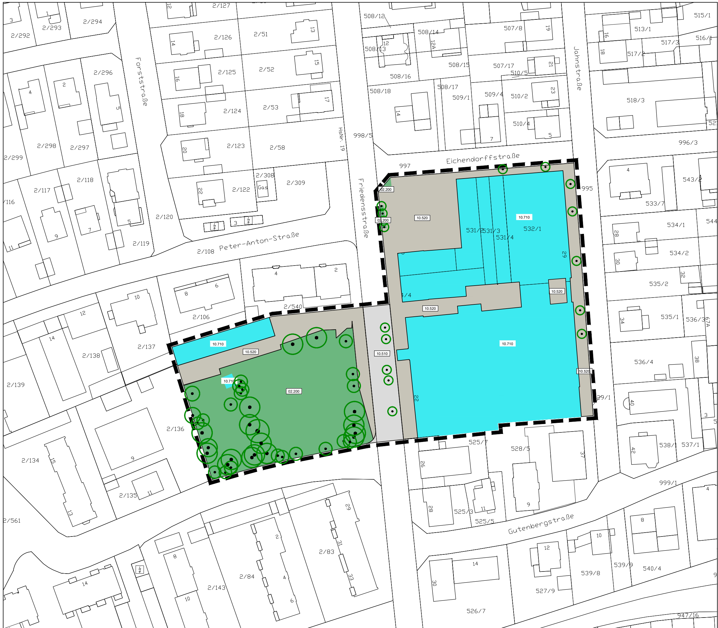
Tabelle der Biotoptypen